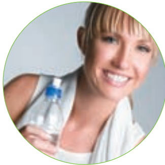
Sport und Fitness