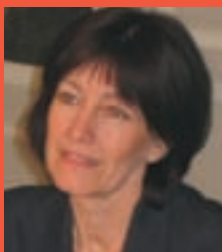
Laurette Onkelinx, Vizepremierministerin und Ministerin für Soziales und Gesundheit der scheidenden Regierung

Warum ist die derzeitige Krise in Belgien eine Gefahr für die Sozialversicherung und was wird die PS tun, um sie in den schwierigen Zeiten, die sicher auf uns zukommen werden, zu bewahren?